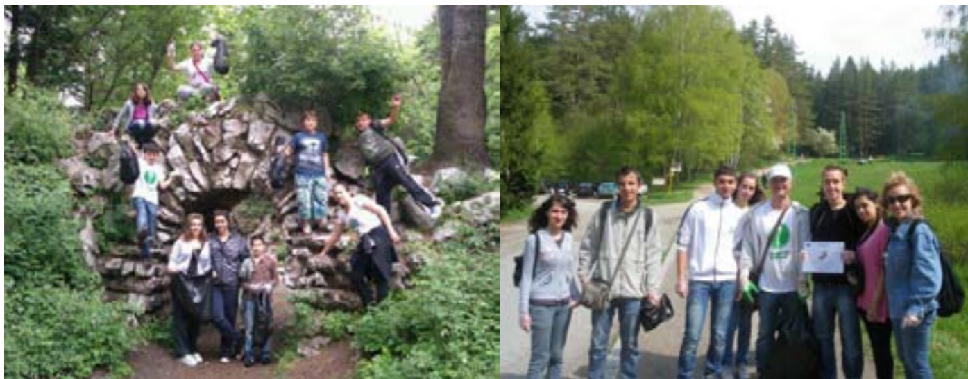
Клуб “Млад журналист” - Западен парк

В дейността се включиха ученици и техните ръководители, работещи по проект УСПЕХ: “Млад активен гражданин”, “Млад журналист”, “Млад еколог”. Желанието се събуди от инициативата, а удовлетворението от пълните чували и красивата гледка.