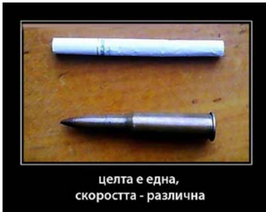
целта е една, скоростта - различна

Е дна цигара. Какво е една цигара!? Къс хартия, малко смачкан тютюн и куп вредни вещества. Ще кажем какво толкова може да ни направи това миниатюрно нещо, та нали ние сме хората и не се плашим от нищо и от никого. Да, това е една малка цигара, която на пръв поглед е безсилна пред големия човек. И ето все пак тя ни убива ден след ден, бавно и неусетно. Тя може да ни причини толкова много неща за малките се размери.