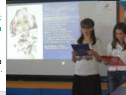
Братята Кирил и Методий